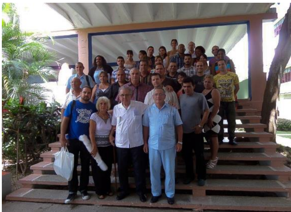
Fig. 7 - Prof. Rodrigo Álvarez Cambras (al centro), en la Jornada provincial de Matanzas (2015).