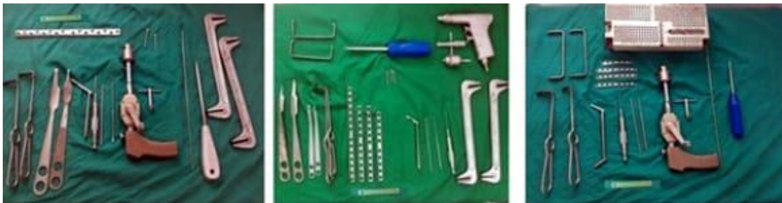
Fig. 2 - Instrumental básico del sistema AO.

La planificación preoperatoria incluyó el uso de implantes, generalmente placas DCP: 4,5 mm anchas y largas para fémur, estrechas en el caso de la tibia, y para las fracturas distales de peroné tenían 1/3 caña con 3,5 mm. Todas se moldearon durante el acto quirúrgico de acuerdo con las características anatómicas del paciente. Para la profilaxis, se administró cefazolina un gramo endovenoso, 15 minutos antes de la operación; en el transoperatorio se sumó un gramo, si la intervención se prolongaba más de una hora, y a las seis horas se añadió otro gramo. La figura 2 muestra el instrumental básico y el material gastable del sistema AO empleado en los diferentes procesos quirúrgicos.